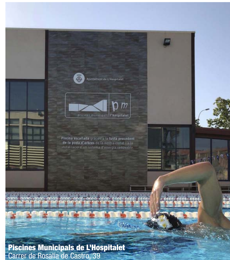
Piscines Municipals de L'Hospitalet Carrer de Rosalía de Castro, 39